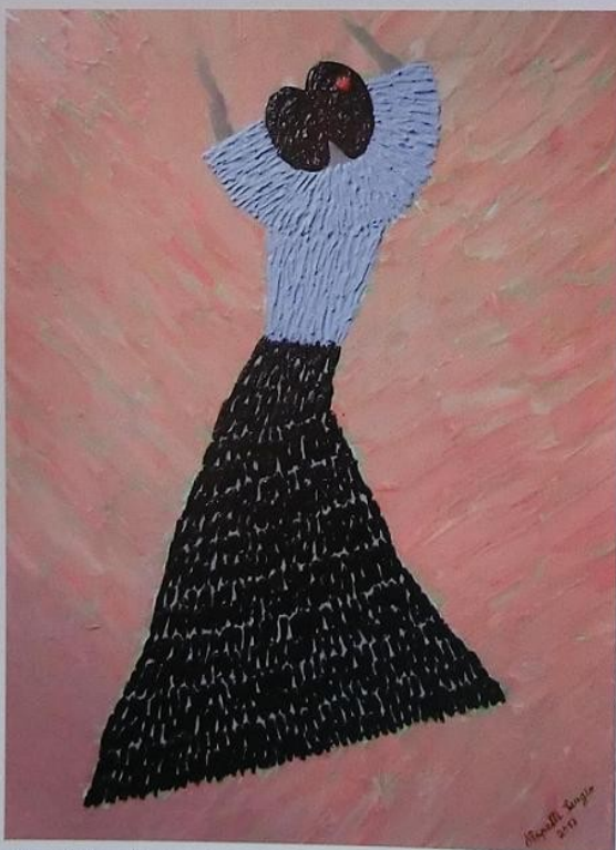
Danzatrice di flamenco