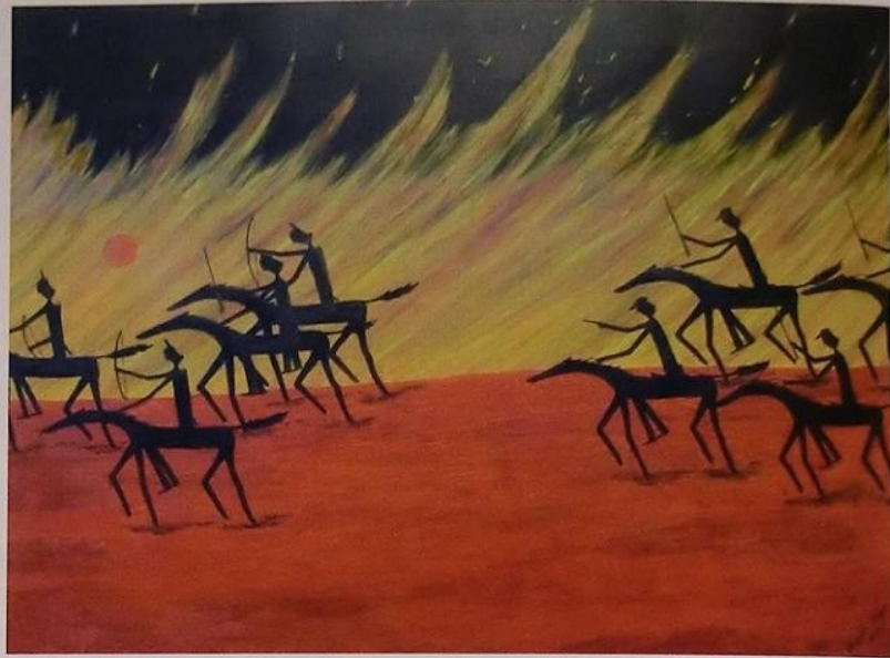
Dipinto per un ricordo storico

riuscì a durare sino al 1940 e che fu nel campo culturale notevole spinta antifascista. Dopo la soppressione della rivista il movimento continuò fino al 1943 attraverso l'attività di artisti e critici in primo piano con Raffaele De Grada. Treccani ne aveva poi sposato la sorella.