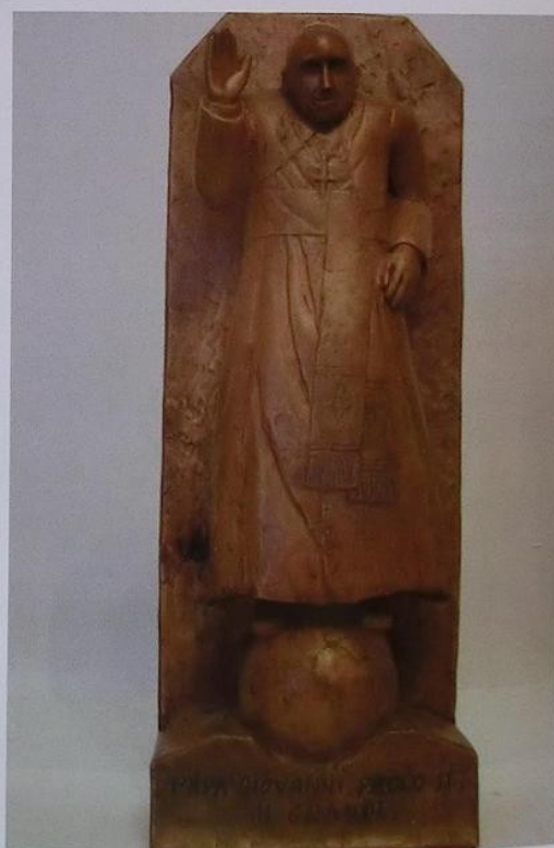
Scultura in legno Papa Giovanni Paolo II